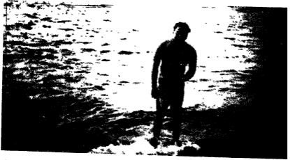
जिन खोजा तिन पाइया गार पानी पैठ क-याकुगारी-समुद्र स्नान (चित्र प्रेमचंद्र जैन)